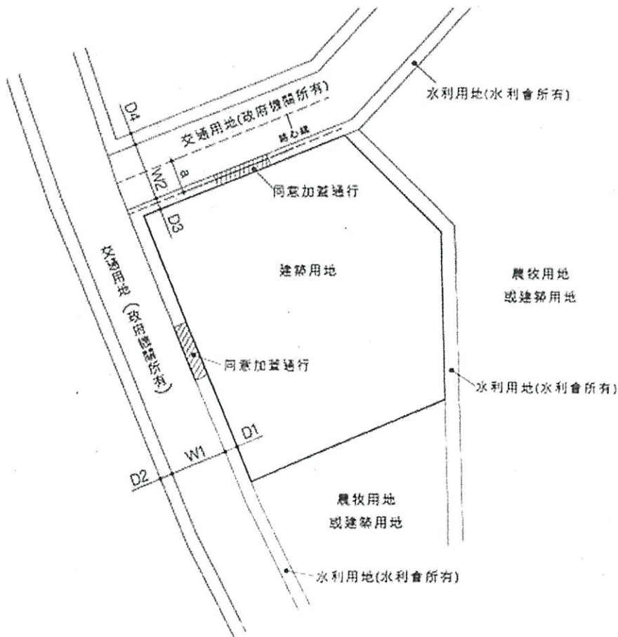
非都市土地之建築基地