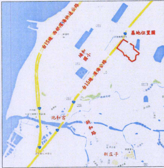
重劃區地理位置圖