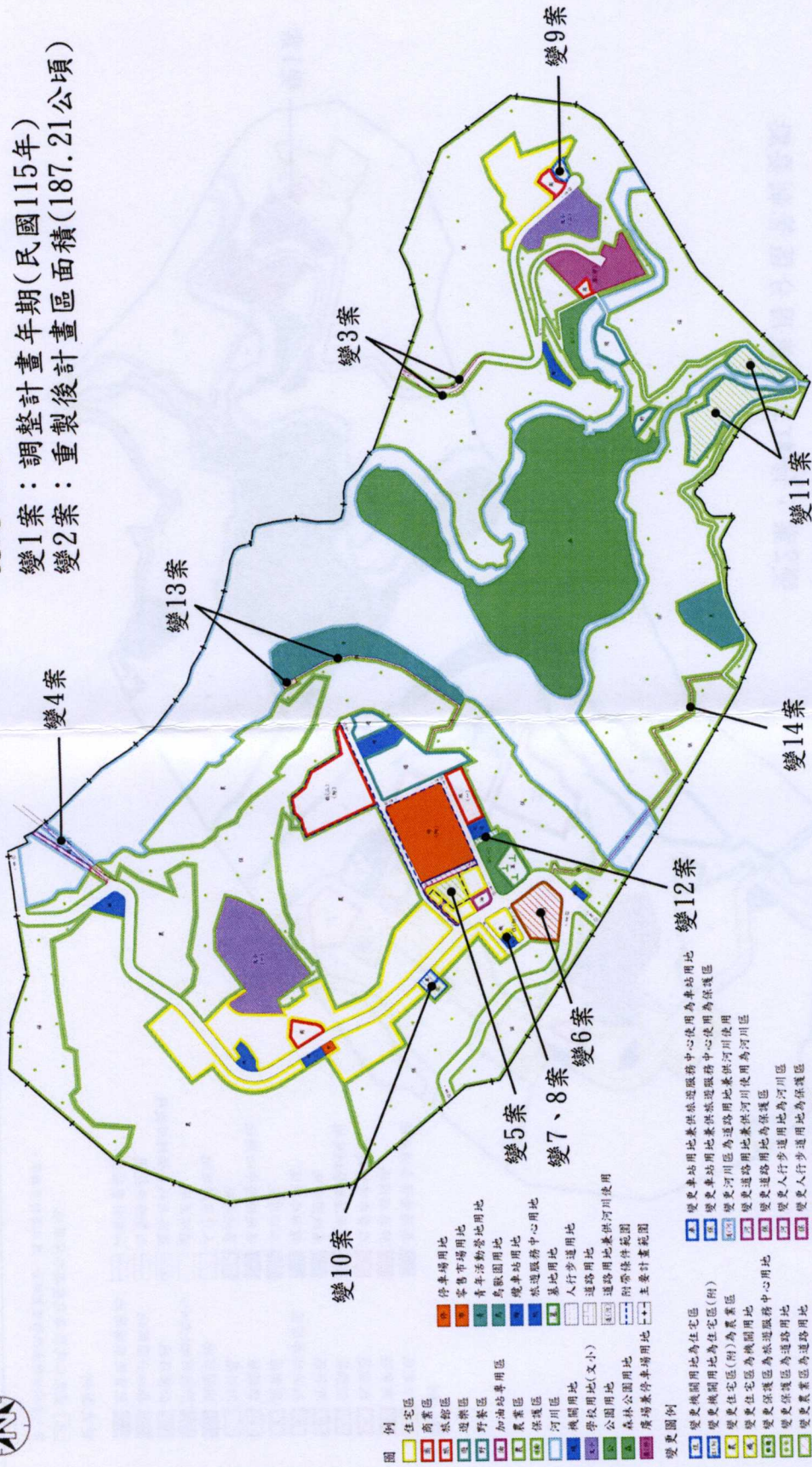
圖1 變更小烏來風景特定區主要計畫(第三次通盤檢討)變更位置示意圖