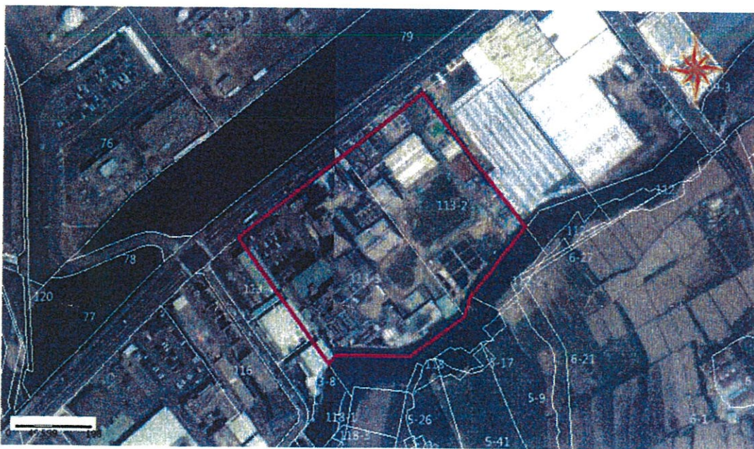
場址廠區範圍套繪地籍圖