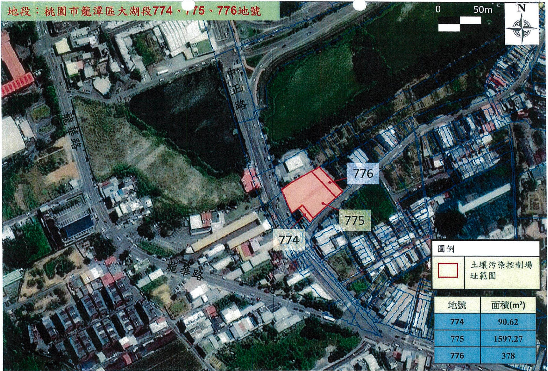
原加得滿龍潭交流道加油站土壤污染控制場址之範圍示意圖