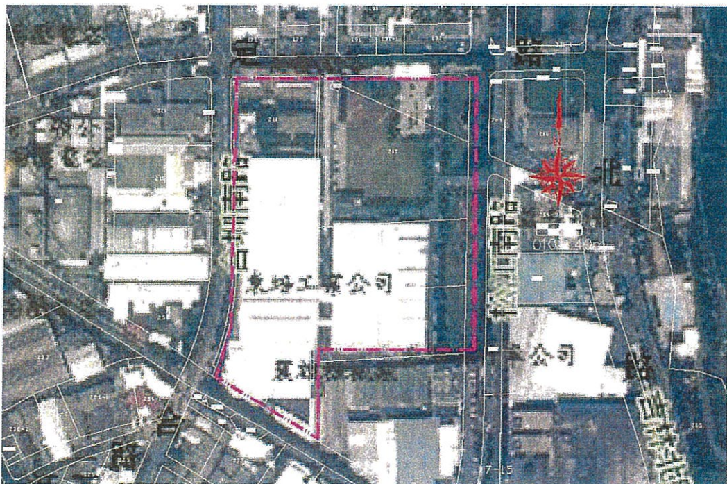
10015 場址廠區範圍套繪地籍圖