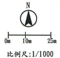
「變更中壢平鎮都市擴大修訂計畫(新街國小西北側住宅區)細部計畫(廣場用地為機關用地)案」示意圖