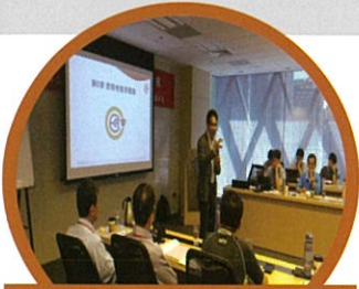
聘請業界專家與 NACE/CIP合格講師