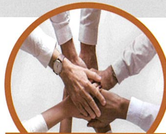
提供業界需求 達成資源共享