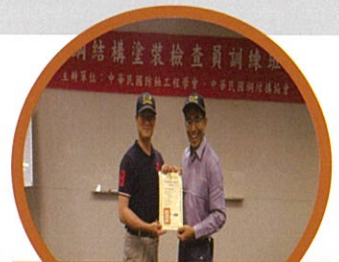
經測驗合格發予證照 為人員資格品質把關