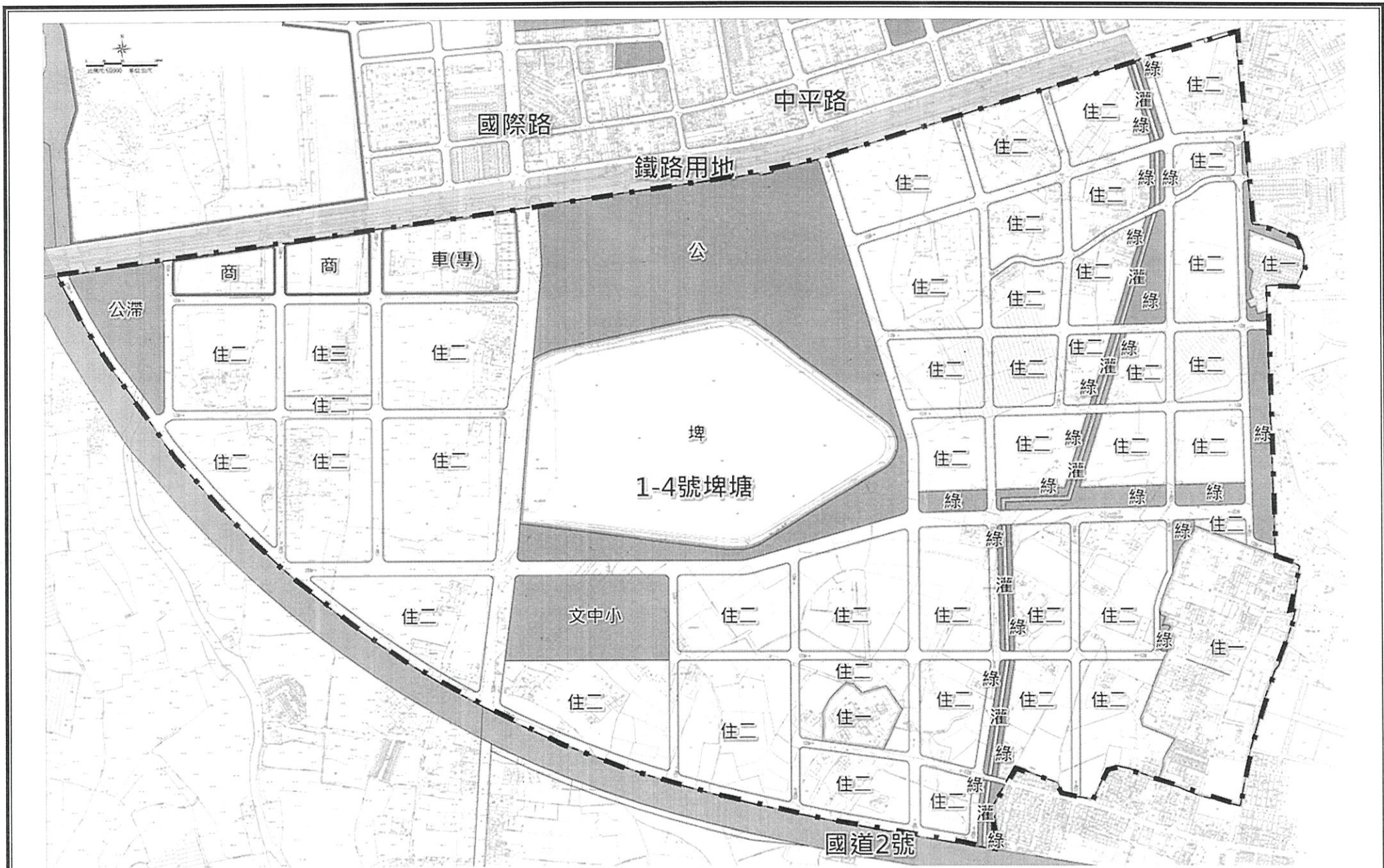
「臺鐵都會區捷運化桃園段地下化建設計畫中車站周邊土地開發計畫」細部計畫示意圖