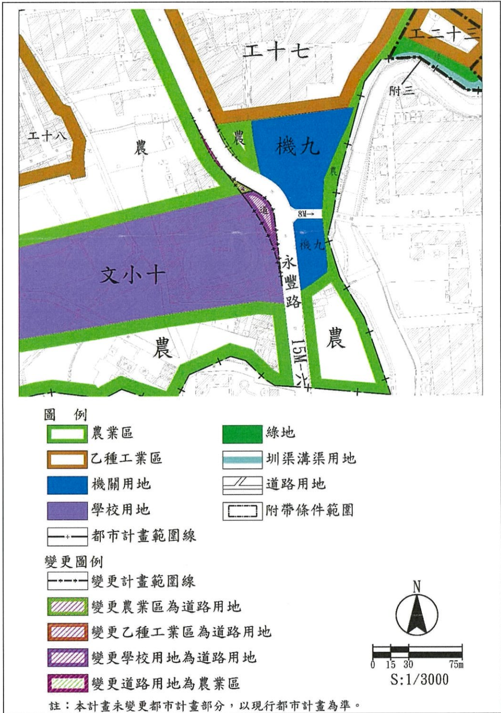
主要計畫變更位置示意圖