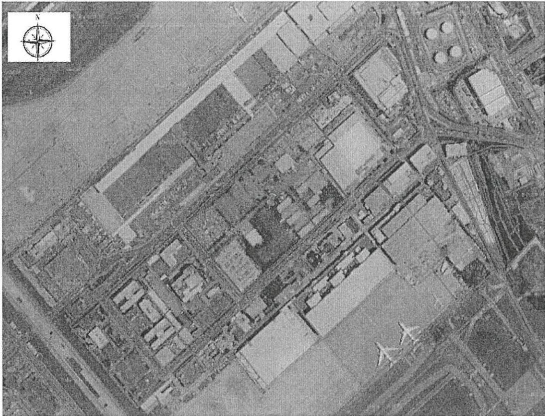
桃園航勤股份有限公司地籍套繪航照圖