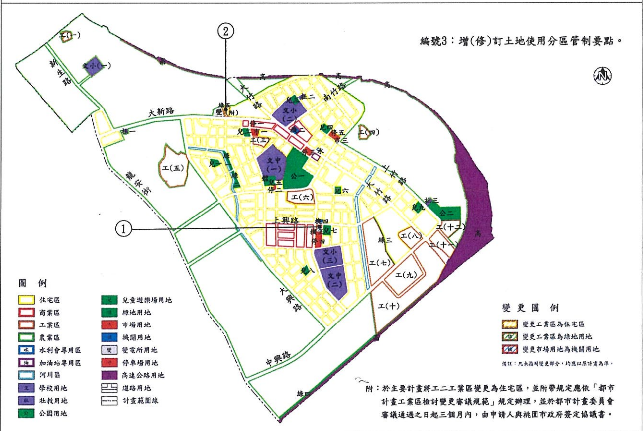
變更蘆竹(大竹地區)都市計畫細部計畫(第一次通盤檢討)案變更位置示意圖