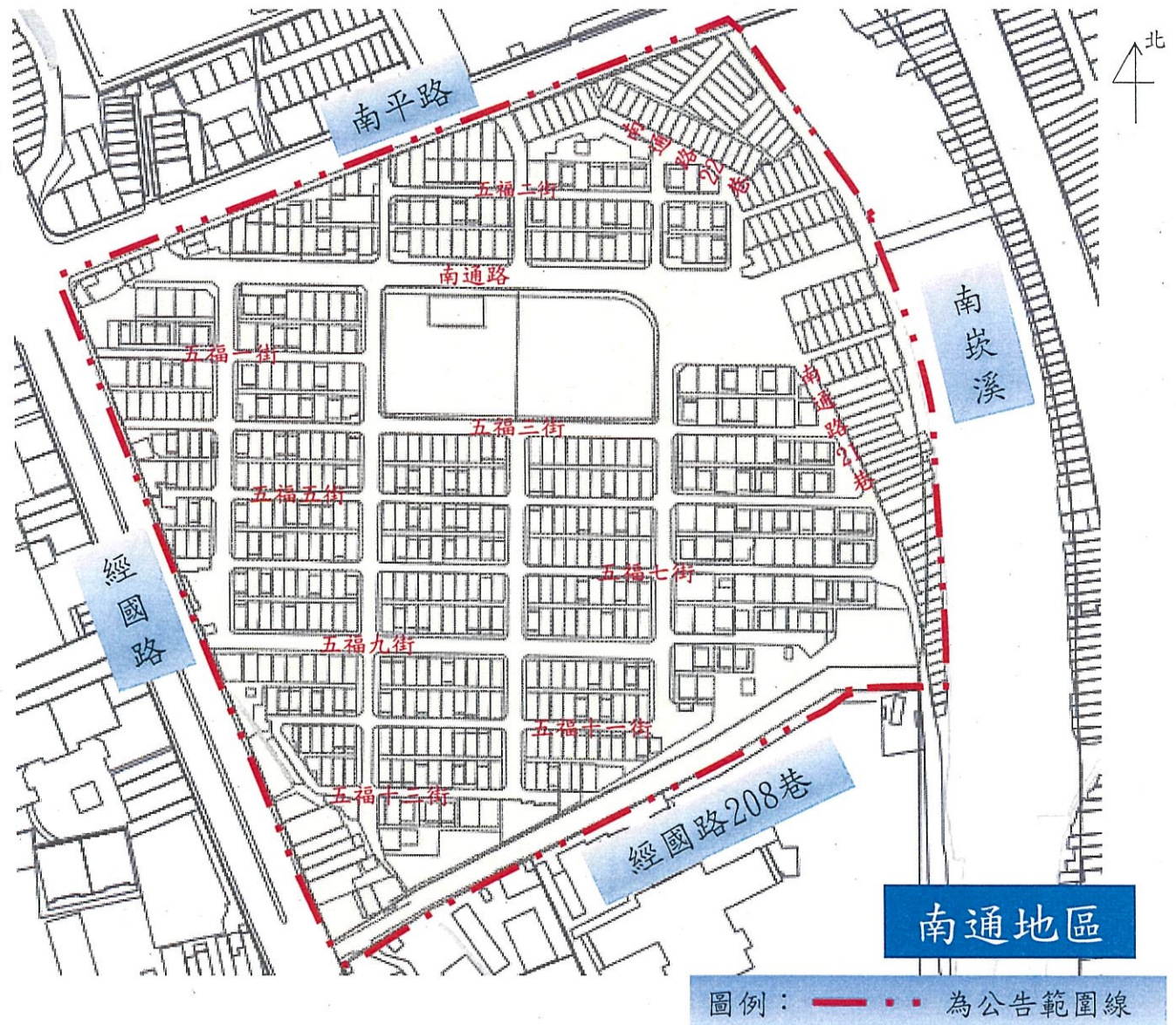
桃園市桃園區污水下水道系統分支管網範圍圖

北至南平路(單號側)、五福二街、南通路、五福一街、南通路22巷、南通路2巷1弄，西至經國路(雙號側)、五福三街、五福五街、五福七街、五福九街，南至經國路208巷(單號側)、五福十一街、五福十三街，東至南崁溪西岸、南通路21巷。