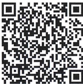
桃園市政府都市發展局 Youtube QRcode

本計畫公展草案內容及陳情意見表下載，請掃描左方 QRcode 或至桃園市政府都市發展局網站，網址： https://urdb.tycg.gov.tw/ 。