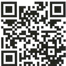
桃園市政府都市發展局 網站 QRcode