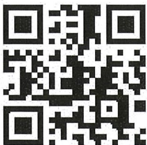
桃園市政府都市發展局 網站 QRcode