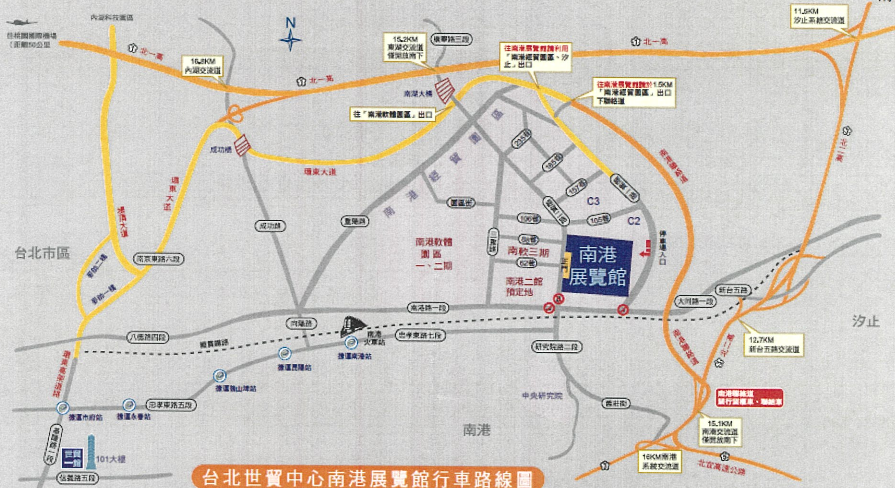
台北世貿中心南港展覽館行車路線圖

往南港展覽館行車路線說明：(南港展覽館衛星導航座標：X(經度)：121° 34' 58.9"、Y(緯度)：25° 47.6")