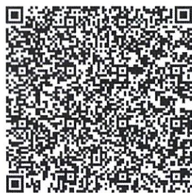
桃園市政府都市發展局 網站 QRcode