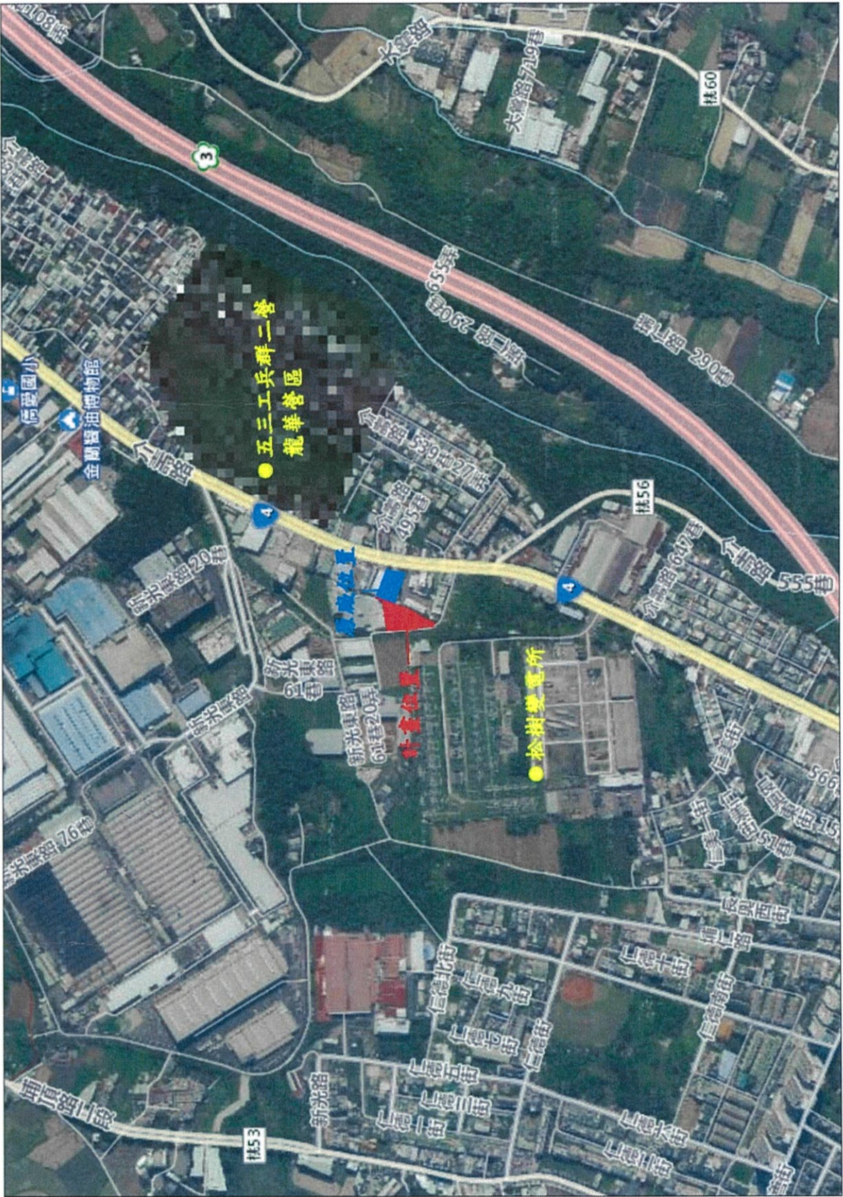
本案變更位置示意圖