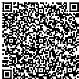
桃園市政府都市發展局 網站 QRcode

各公民或團體對計畫案如有任何意見，請利用說明會場所提供之意見表，於公開展覽期間以書面載明姓名或名稱及地址，向本府都市發展局及大園區公所提出(陳情意見表於本府都市發展局都市計畫科索取，或至本府都市發展局網站下載)。如有疑義，歡迎電洽本府都市發展局都市計畫科。(03-3322101#5226 陳小姐)