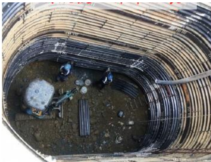
圖 6.5 鋼襯板工作井

(2) 鋼襯板工作井多設於卵礫石層，組成構件具模組化生產特性，假設工程完成後，需將上部鋼襯板抽除，可回收使用、降低單位成本。