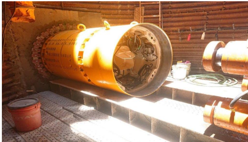
圖 6.1 密閉式推進機械