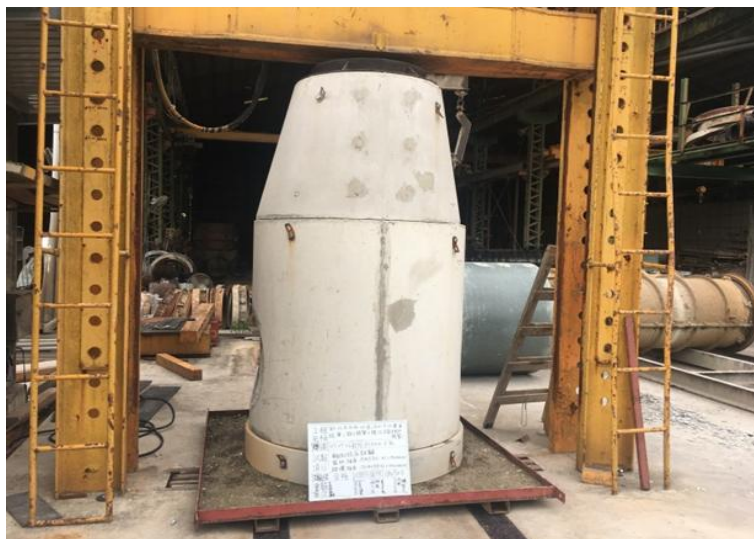
圖 6.4 預鑄 RC 人孔