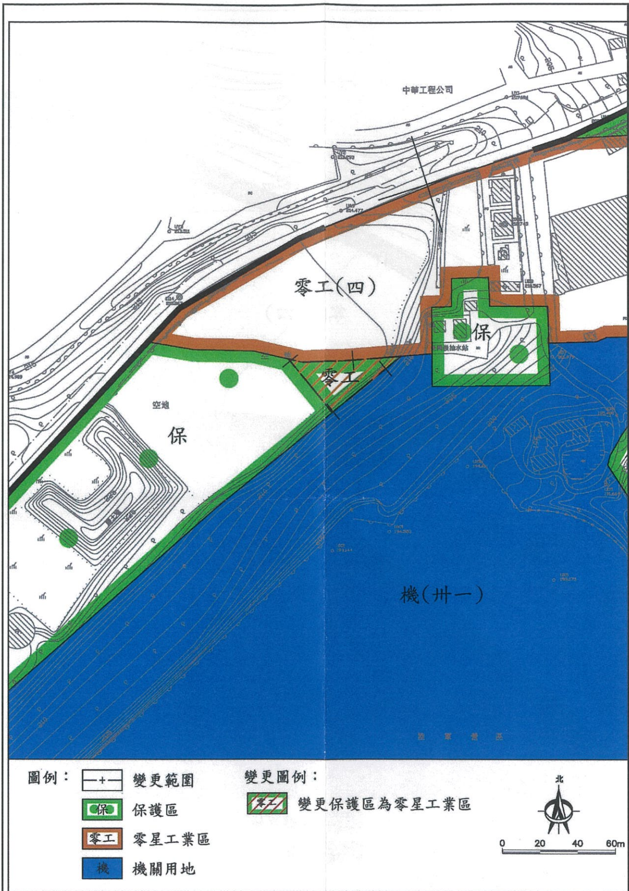
主要計畫變更內容示意圖