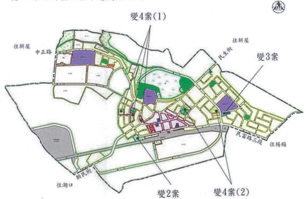
變1：修訂計畫目標年為民國125年