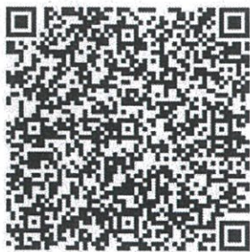
桃園市政府都市發展局 網站 QRcode

各公民或團體對計畫案如有任何意見，請利用說明會場所提供之意見表，於公開展覽期間以書面載明姓名或名稱、地址及建議事項，向本府都市發展局及龍潭區公所提出(陳情意見表於本府都市發展局都市計畫科索取，或至本府都市發展局網站下載)。如有疑義，歡迎電洽本府都市發展局都市計畫科(03-3322101#5225 魏小姐)、經濟部水利署北區水資源局(03-4712001#416 蔡先生)。