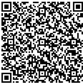
桃園市政府都市發展局 網站 QRcode

各公民或團體對計畫案如有任何意見，請利用說明會場所提供之意見表，於公開展覽期間以書面載明姓名或名稱、地址及建議事項，向本府都市發展局及楊梅區公所提出(陳情意見表於本府都市發展局都市計畫科索取，或至本府都市發展局網站下載)。如有疑義，歡迎電洽本府都市發展局都市計畫科(03-3322101#5224 謝小姐)、本府工務局規劃設計科(03-3322101#6754 林小姐)。