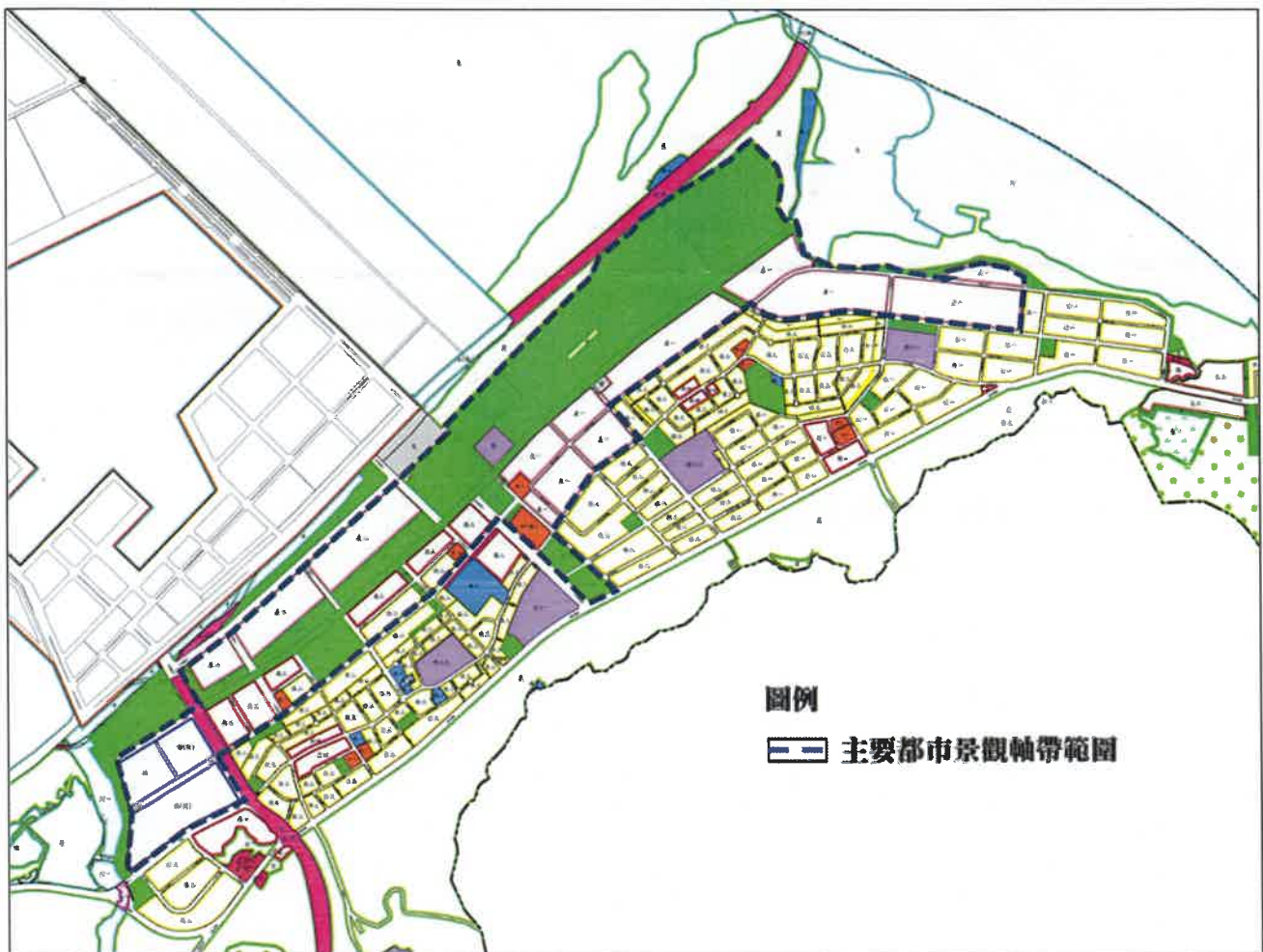
附圖一：臺北港特定區重要軸線範圍圖

八、本審議原則若執行上有疑義時，得經本市都市設計審議及土地使用開發許可審議會作成共通性決議後據以執行。