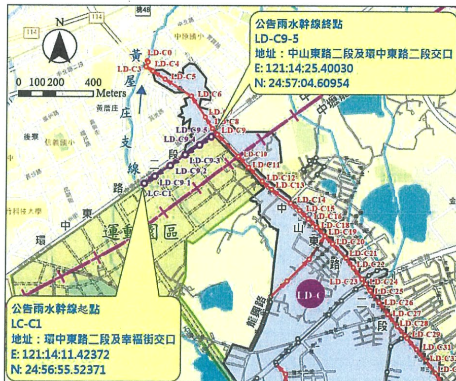
LD-C9 支線排水區域範圍圖