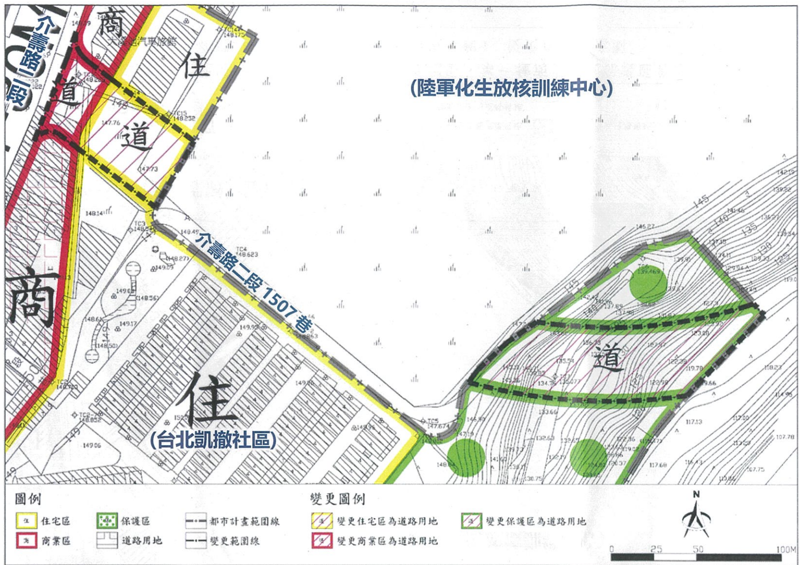
「變更大溪鎮(埔頂地區)主要計畫(部分住宅區、商業區及保護區為道路用地) (配合國道3號增設桃園八德交流道工程)案」變更內容示意圖