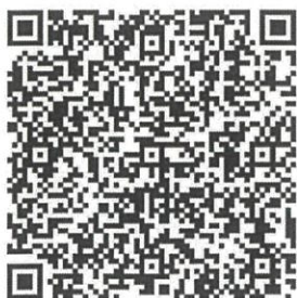
桃園市政府都市發展局 網站 QRcode

各公民或團體對計畫案如有任何意見，請利用說明會場所提供之意見表，於公開展覽期間以書面載明姓名或名稱、地址及建議事項，向本府都市發展局、桃園區公所、蘆竹區公所或龜山區公所提出（陳情意見表於本府都市發展局都市計畫科索取，或至本府都市發展局網站下載）。如有疑義，歡迎電洽本府都市發展局都市計畫科（03-3322101#5223 羅小姐）。