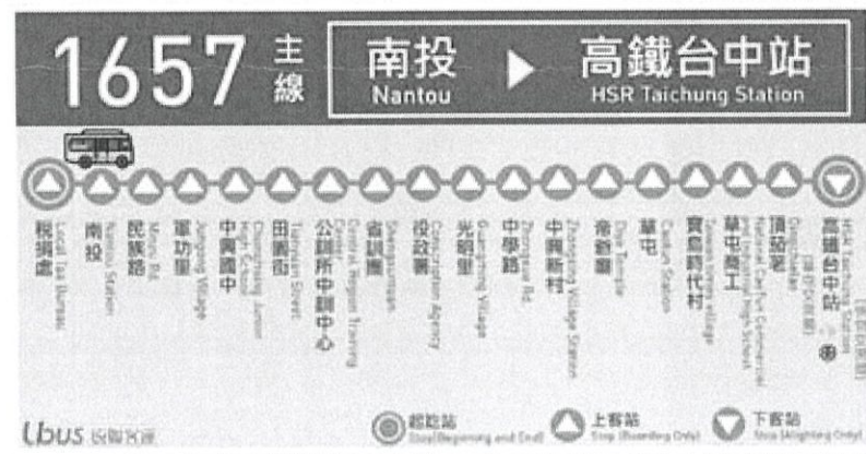
【大眾運輸 / 台中高鐵統聯客運 1657 路線圖】