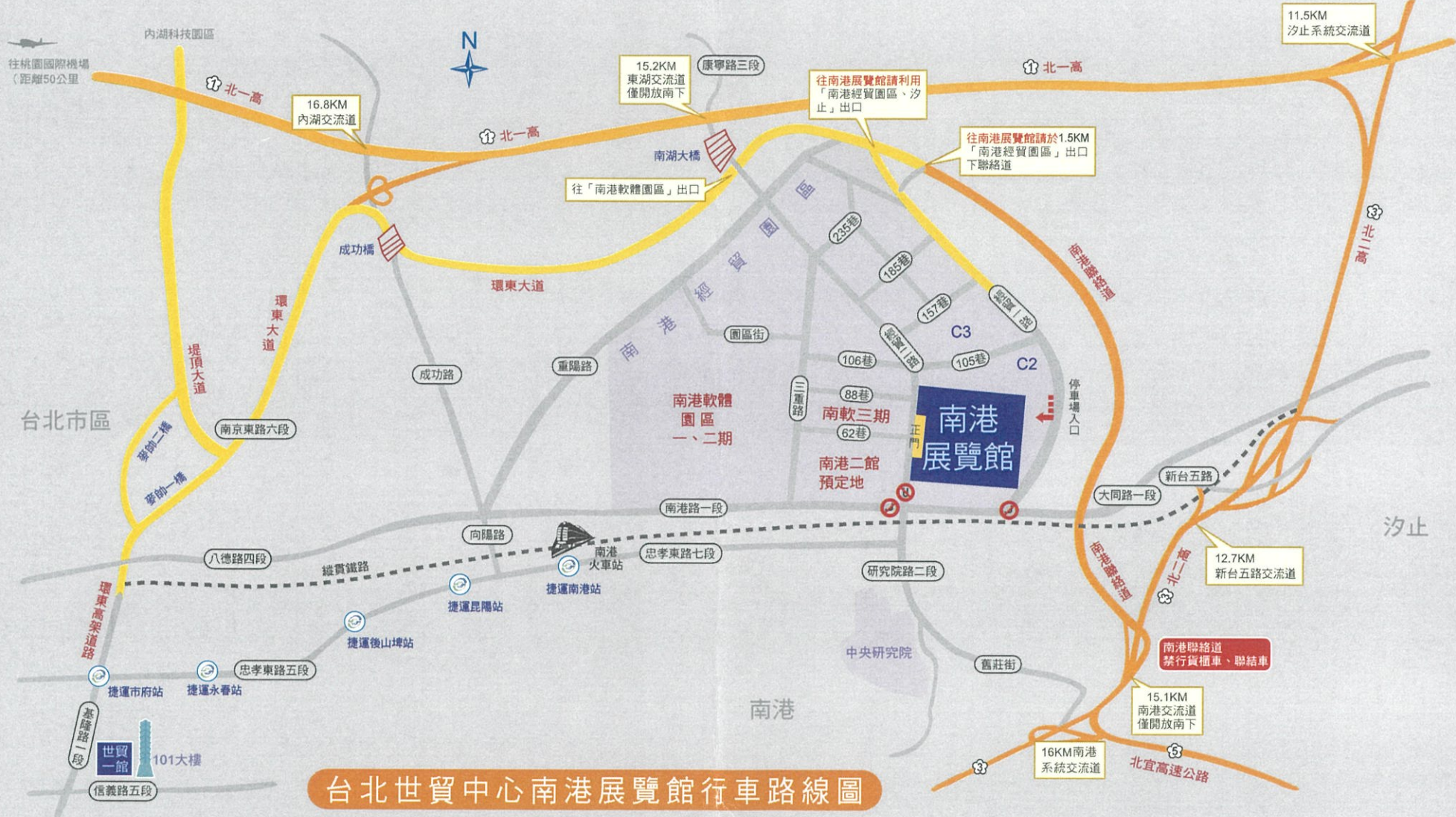
台北世貿中心南港展覽館行車路線圖

往南港展覽館行車路線說明：(南港展館衛星導航座標：X(經度):121° 34' 58.9"、Y(緯度): 25° 47.6")