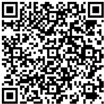
桃園市政府都市發展局 網站 QRcode

各公民或團體對計畫案如有任何意見，請利用說明會場所提供之意見表，於公開展覽期間以書面載明姓名或名稱、地址及建議事項，向本府都市發展局及平鎮區公所提出(陳情意見表於本府都市發展局都市計畫科索取，或至本府都市發展局網站下載)。如有疑義，歡迎電洽本府都市發展局都市計畫科(03-3322101#5224 謝小姐)。