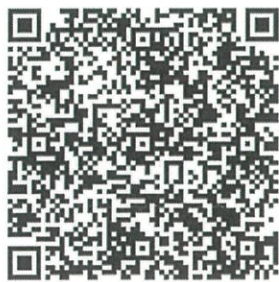
桃園市政府都市發展局 網站 QRcode

各公民或團體對計畫案如有任何意見，請利用說明會場所提供之意見表，於公開展覽期間以書面載明姓名或名稱、地址及建議事項，向本府都市發展局及本市龜山區公所提出(陳情意見表於本府都市發展局都市計畫科索取，或至本府都市發展局網站下載)。如有疑義，歡迎電洽本府都市發展局都市計畫科(03-3322101#5225 黃小姐)。