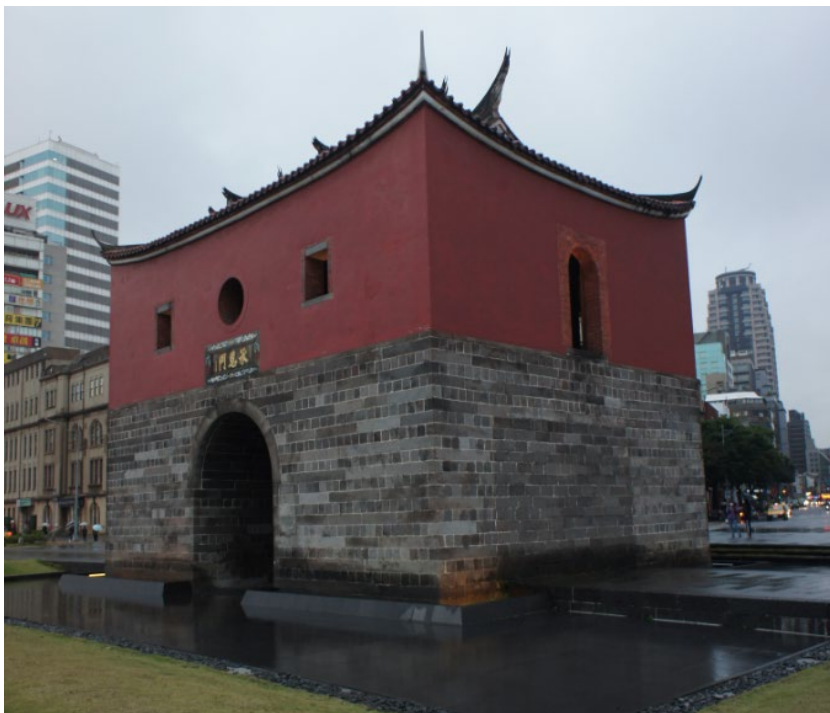
照片 1 國定古蹟臺北府城北門修復工程（暫訂）