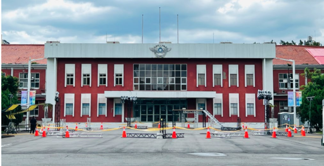
照片 2 國定古蹟空軍總司令部（原臺灣總督府工業研究所）