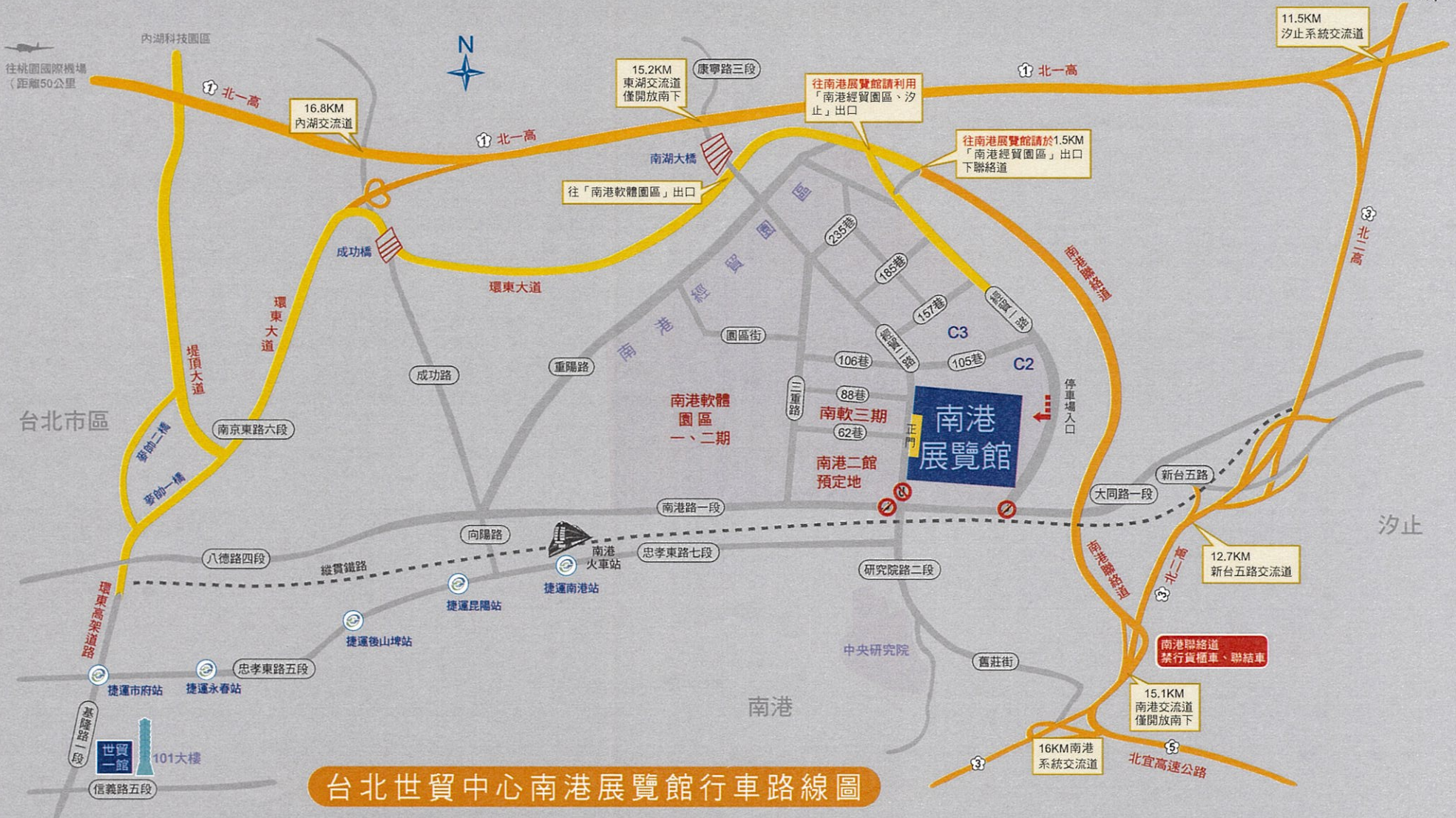
台北世貿中心南港展覽館行車路線圖

往南港展覽館行車路線說明：(南港展覽館衛星導航座標：X(經度):121° 34' 58.9"、Y(緯度): 25° 47.6")