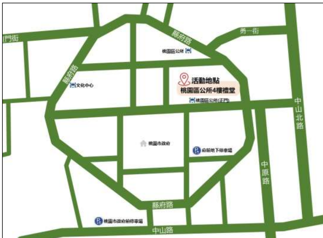
桃園市桃園區公所位置示意圖

高鐵桃園站→中厝→新莊國小→廟前→胡厝→愛國一路→大同街口→上大竹循原路至永安路口→博愛街口→民族路口（終點站），建議您在終點站下車，然後至中正路與復興路口的桃園客運站，換乘 1 路，1 甲，101，107 公車市區公車，至市政府站下車。